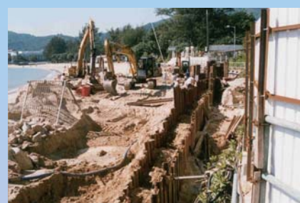
于涌口村进行的渠务建筑工程