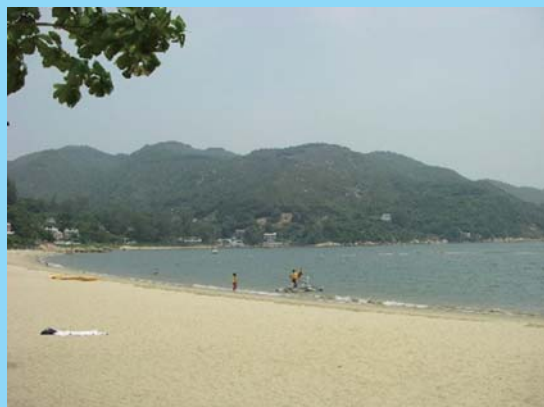
景色优美的银矿湾泳滩